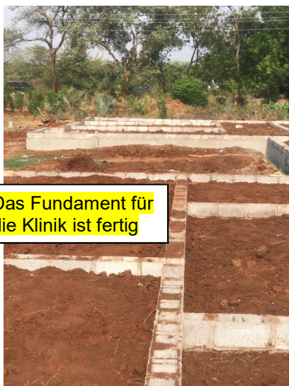
Das Fundament für die Klinik ist fertig

Heute habe ich wieder die Freude, viel Gutes von den Projekten berichten zu können. Der Neubau eines Schulgebäudes in Fountain Gate ist fast fertiggestellt. Auch die anderen, zu diesem Projekt gehörenden Komponenten sind im Zeitplan, auch die Arbeiten im Bagdad Compound. Das Kinderdorf und auch die Mubuyu Mädchenschule arbeiten weiter unermüdlich, um zahlreichen Kindern Bildung und Ausbildung zu vermitteln. Nebenbei setzen wir auch die Lebensmittelhilfe für Hungernde fort.