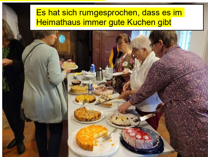
Es hat sich rumgesprochen, dass es im Heimathaus immer gute Kuchen gibt

Heute habe ich wieder die Freude, viel Gutes von den Projekten berichten zu können. Der Neubau eines Schulgebäudes in Fountain Gate ist fast fertiggestellt. Auch die anderen, zu diesem Projekt gehörenden Komponenten sind im Zeitplan, auch die Arbeiten im Bagdad Compound. Das Kinderdorf und auch die Mubuyu Mädchenschule arbeiten weiter unermüdlich, um zahlreichen Kindern Bildung und Ausbildung zu vermitteln. Nebenbei setzen wir auch die Lebensmittelhilfe für Hungernde fort.