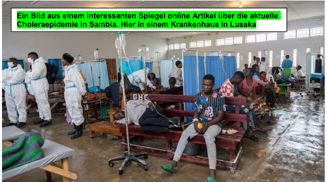
Ein Bild aus einem interessanten Spiegel online Artikel über die aktuelle Choleraepidemie in Sambia. Hier in einem Krankenhaus in Lusaka

Der Cholera-Ausbruch in Sambia ist ein Riesenproblem, seit Jahrzehnten der größte. Die Kliniken sind überfüllt, wie hier in Lusaka. Allein in der Hauptstadt sind mehr als 600 Menschen daran gestorben. Das Fußballstadion von Lusaka wurde zur Behandlungsstätte für Cholera-