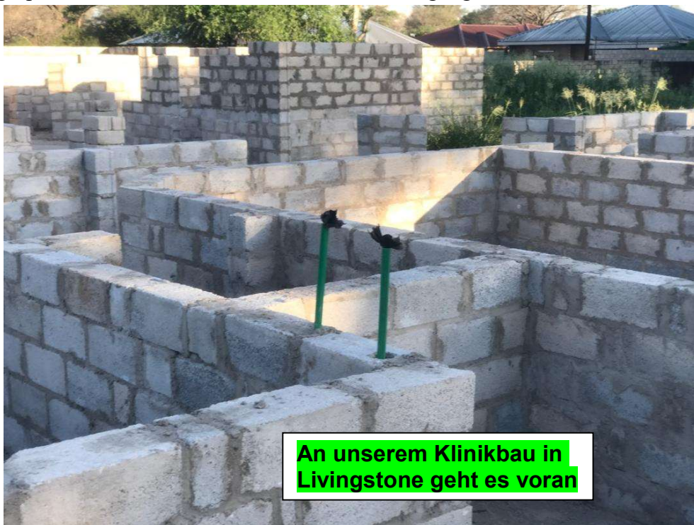
An unserem Klinikbau in Livingstone geht es voran

Inzwischen wurden alle Spendenbescheinigungen verschickt. Bitte melden Sie sich, falls Sie im letzten Jahr spendet haben, Ihnen aber noch keine Bestätigung zusammen mit dem Jahresbericht vorliegt.