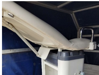
Es war ein Problem, diesen über 100 kg schweren gynäkologischen Stuhl aus dem Anhänger zu bekommen

Container im Moorweg in Jesteburg aufstellen, der mit Klinikausrüstung gefüllt und nach Sambia verschifft wird.