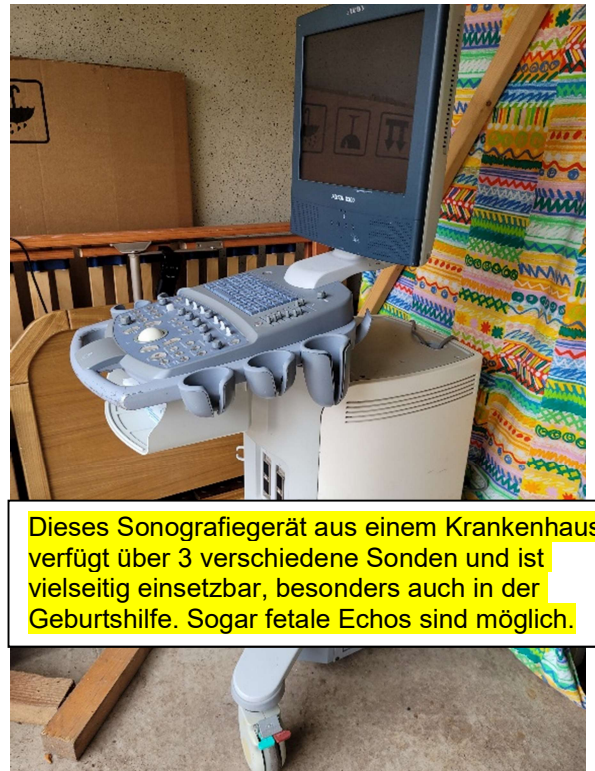
Dieses Sonografiegerät aus einem Krankenhaus verfügt über 3 verschiedene Sonden und ist vielseitig einsetzbar, besonders auch in der Geburtshilfe. Sogar fetale Echos sind möglich.

Ein Teil der Hilfsgüter haben wir bereits, wie ein Sonografie-Gerät für die klinische Anwendung, einen gynäkologischen Stuhl, EKG u.a.m. Von der Waldklinik Rüsselkäfer in Jesteburg