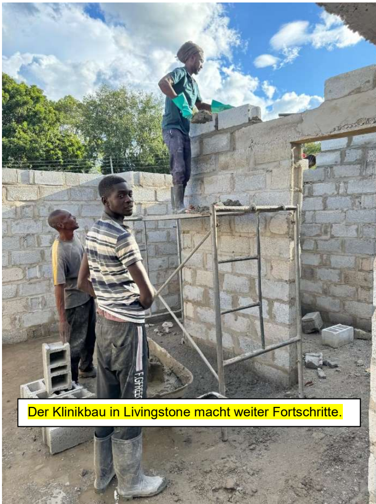
Der Klinikbau in Livingstone macht weiter Fortschritte.