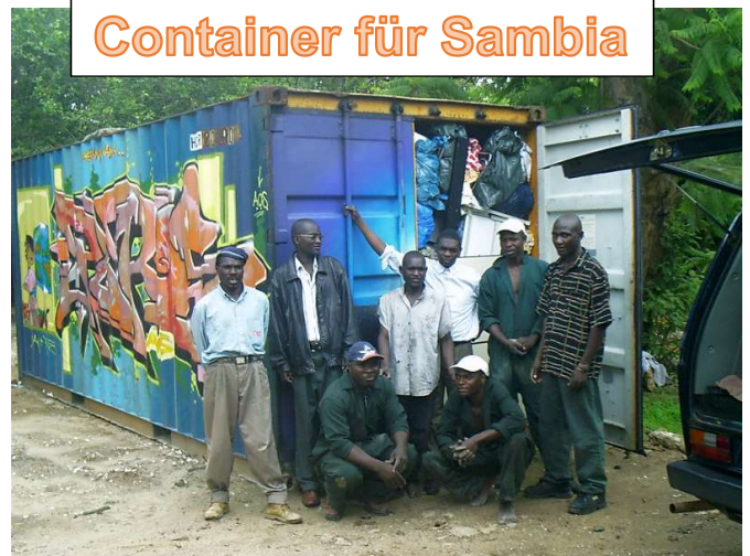
Container für Sambia

Hier ein vor Jahren von uns nach Sambia geschickter 20-Fuß Container